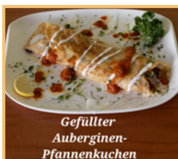
Gefüllter Auberginen- Pfannenkuchen